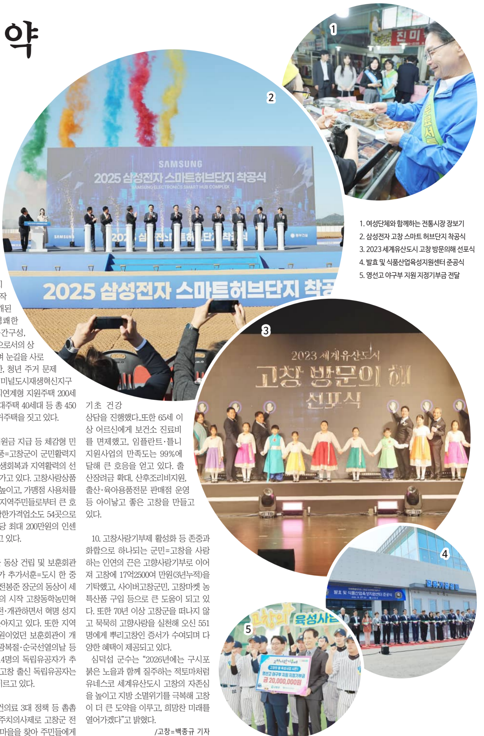
1. 여성단체와 함께하는 전통시장 장보기 2. 삼성전자 고창 스마트 허브단지 착공식 3. 2023 세계유산도시 고창 방문의 해 선포식 4. 발효 및 식품산업육성지원센터 준공식 5. 영성고 야구부 지원 지정기부금 전달