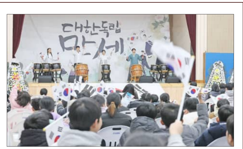
'제107주년 오수 3.10만세 기념 행사'가 오수를 사랑하는 청년회주관으로 지난 10일 임실군 오수면 일대에서 열렸다