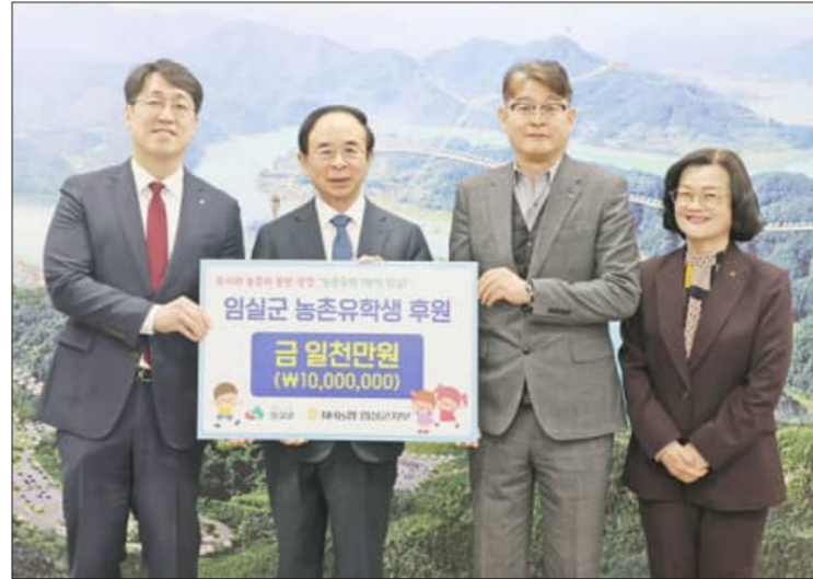
농협은행 임실군지부가 11일 농촌유학생 가족을 지원해달라며 임실군에향장학회에 1천만원을 지정 기탁했다