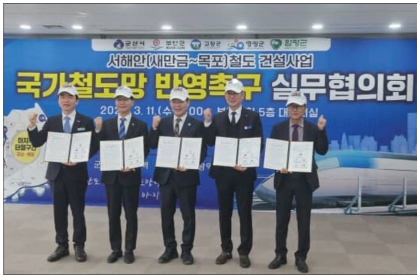
11일 개최된 군산~목포간 철도 건설 업무협약

협약서에는 △국가철도망 구축계획 및 관련 상위계획 반영을 위한 공동 대응 △중앙정부 및 국회 대상 정책 건의 및 공동 방문 활동 △경제성 분석 제고를 위한 공동 연구 및 논리 개발 △주민 공감대 형성 및 홍보 활동 추진 △관련 학술포럼, 토론회, 정책 세미나 공동 개최 등에 대해 상호 협력한다는 내용이 포함됐다.