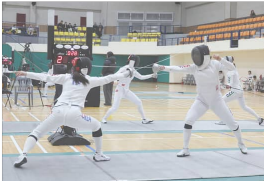
제28회 한국실업펜싱연맹회장배 전국 남녀펜싱선수권대회