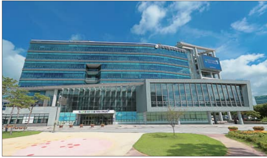
교육은 단순히 지식을 전달하는 것에 그치지 않아 민주시민으로서 필요한 자질을 갖추게 하는 삶의 태도를 기르는 것"이라며 "서로의 다름을 인정하고 연대하며, 당당한 민주주의 사회의