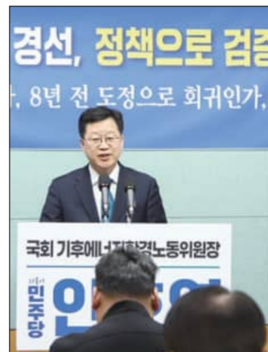
안호영 도지사 경선후보가 16일 전북도의회에서 전북 발전 전략 중심의 토론을 제안하는 기자회견을 갖고 있다.

안 후보는 “당정이 흔들리면 국정도 실패하고 전북 발전도 실패한다”며 “전북 발전을 위해서는 대통령,