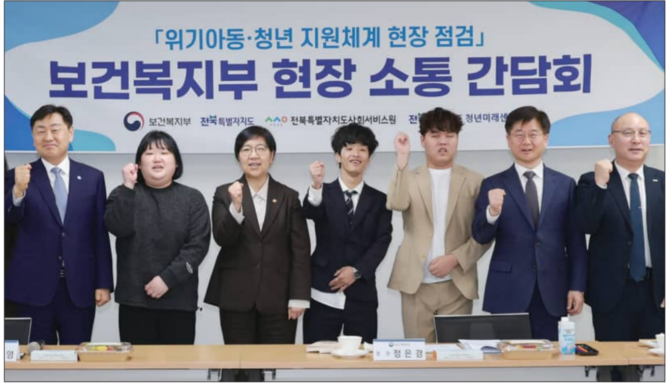
‘위기아동·청년법’ 앞두고 16일 전북 청년미래센터에서 열린 위기아동·청년 지원체계 보건복지부 현장 소통 간담회에 정은경 보건복지부 장관, 김관영 지사 등 참석자들이 기념촬영을 갖고 있다. (관련기사 2면)