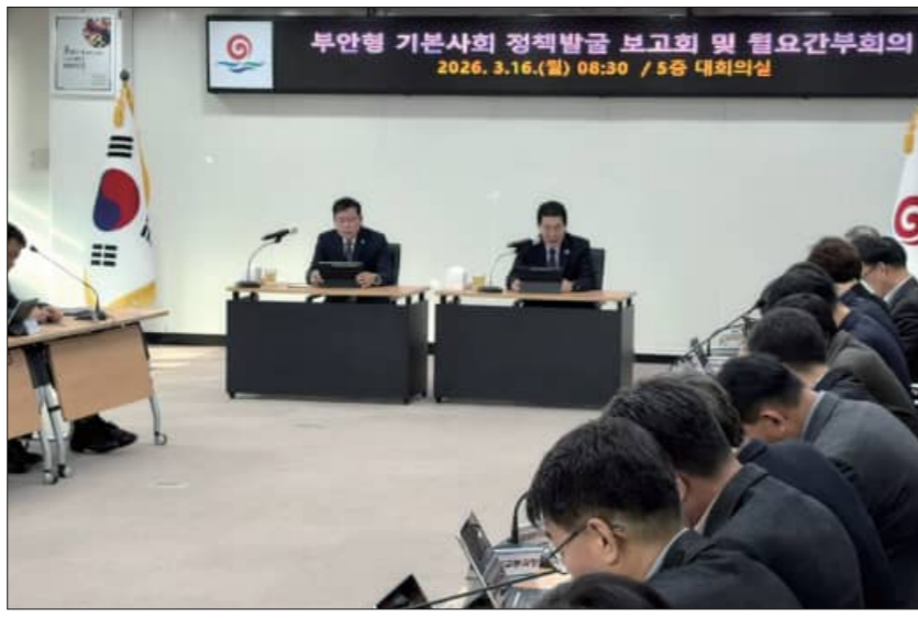
16일 개최된 부안형 기본사회 구현 정책 발굴 보고회

이는 부서별로 흩어져 있던 기존 사업들을 기본사회라는 틀 안에서 재구조화하고 확대해 군민의 삶의 수준을 향상시키고 해상풍력 수익과 국·도비 등 재원 확보 방안을 연계함으로써 군민 누구나 품격 있는 삶을 누리는 부안