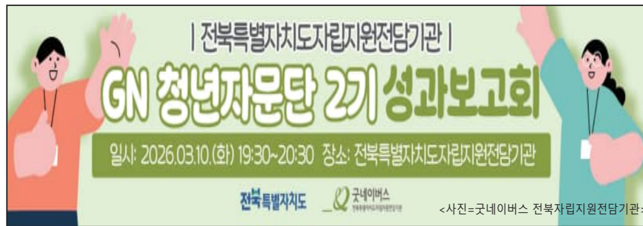
자립지원전담기관장은 "GN청년자문단은 자립준비청년이 단순한 지원 대상이 아니라 정책과 사업 개선에 직접 참여하는 주체로서 목소리를 낼 수 있도록 하는 주도적인 활동을 지난 한 해 동안 진행했다"며 "앞으로도 자립준비청년의 의견을 적극 반영해 지역사회 문제 해결과 청년 권익 증진을 위한 다양한 활동을 이

수렴하고 이를 본 기관의 사업과 정책, 제도 개선 방향에 반영하기 위한 다양한 활동을 펼쳤다.