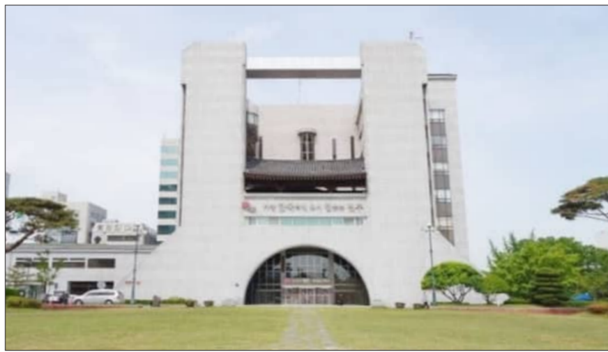
이에 시는 지난해 9월 전북도와 전북대학교 등과 함께 피지컬AI 선도모델 수립 및 PoC(기술검증) 사업에 참여해 피지컬 AI 기술 실증 위한 기반조성 가능성을 확인한 바도 있다. 시는 추진단을 중심으로 피지컬AI-J밸리 조성에서 △종합계획 수립 △연구·실증 인프라 구축 △피지컬AI 기업 및 연구기관 유치 △산·학·연 협력 네트워크 구축 △국가예산사업 기금 및 발굴 △스타트업 발굴 및 지원 등 사업 전반에 대해 중장기적 관점의 대응 전략을 마련할 계획이다.

전주시 '피지컬AI-J밸리' 사업 전반 전담 조직인 '피지컬AI-J밸리 추진단'이 신설·운영된다. 추진단은 앞으로 전주를 대한민국 피지컬AI 산업 핵심 기지부터 △인프라 구축 △기업 유치에 이르기까지 컨트롤타워 역할을 수행하게 된다. 최근 '피지컬AI'는 로봇·제조·자율주행 등 실제 산업 현장에서 작동하는 인공지능 기술로서 제조 혁신과 산업 패러다임 전환을 이끄는 핵심 기술로 주목받고 있다.