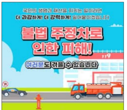
이제 전주덕진소방서는 현장대원의 부담을 줄이고 신속한 판단이 가능하도록 현장 지휘관과 119상황실 간 공조체계를 강화한다.