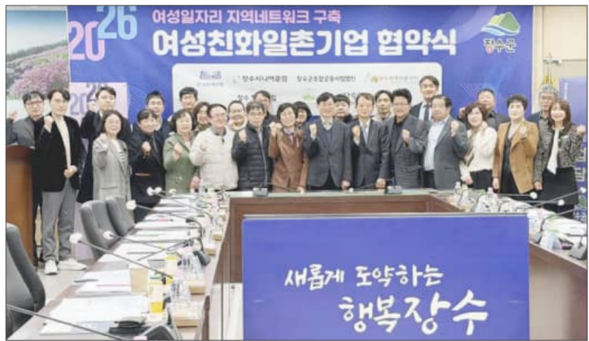
장수군은 지난 16일 전북광역여성새로일하기센터와 함께 지역 내 7개 기업과 '여성친화 일촌기업' 업무협약을 체결했다

협약을 체결한 기업은 △주식회사신진에스엠(대표 김은식, 김은주) △장수시니어클럽(대표 김숙희) △장수군조합공동사업법인(대표 최철학) △장수지역자활센터(대표 김구중) △장수 평화의집(대표 차복순) △나눔농행복사회적협동조합(대표 김태현) △장수도깨비동굴김치영농조합법인(대표 고석일) 등 총 7개소이다.