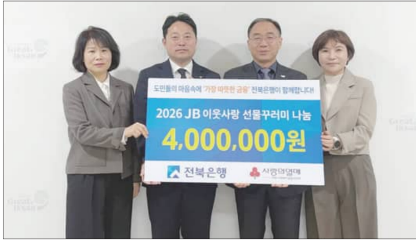
익산시는 17일 시정을 찾은 전북은행과 나눔 물품 기탁식을 진행했다. 선물꾸러미를 준비했다"며 "전북은행은 회공헌 활동을 지속적으로 이어가겠다"고 말했다. 지역사회와 함께 성장하는 금융기관으로서 도움이 필요한 이웃들을 위한 사