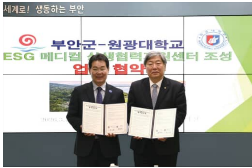
지난 16일 부안군-원광대학교 ESG 메디컬 상생협력 지원센터 조성 업무협약이 체결됐다.

구체적으로는 ESG 메디컬 상생협력 지원센터 조성 및 운영, 해양 치유 및