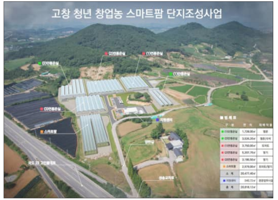
고창 청년 창업농 스마트팜 단지조성사업

지방소멸대응기금은 인구가 줄어 소멸 위기에 처한 지자체를 돕기 위해 정부에서 2022년 '지방자치단체 기금관리기본법' 제22조 1항에 따라 도입한 자금으로, 10년간(2022년~2031년) 매년 1조 원 규모로 지원한다. 고창군은 이 기금을 청년 주거 여건 개선과 생활인구 확대를 위한 핵심 재원으로 활용하고 있다. 고창군 지방소멸 대응기금 집행현황을 살펴봤다.