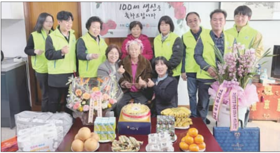
를 살아오신 어르신의 삶은 고창군의 소중한 역사이자 자산이다"며 "앞으로도 어르신을 공경하는 사회 분위기를 조성하고, 어르신들이 더욱 행복한 노후를 보내실 수 있도록 최선을 다하겠다"고 말했다. /고창=백종규 기자