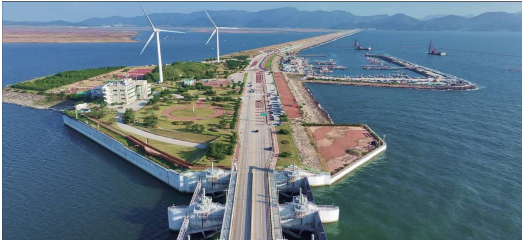
전북은 대규모 투자와 국가 전략사업을 발판으로 산업 지형을 바꾸는 전환의 기로에 서 있다. 새만금 가력도 일대 전경. (관련기사 16면)

창간 15주년을 맞은 전북타임스는 지금, 전북이 어디에 서 있는지, 그리고 어디로 나아가야 하는지 뒤돌아 보며 묻는다.