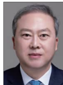
양오봉 전북대학교 총장

선도하고 있는 전북타임스가 창간 15주년을 맞았습니다. 전북대학교 가족을 대신하여 진심으로 축하드립니다.