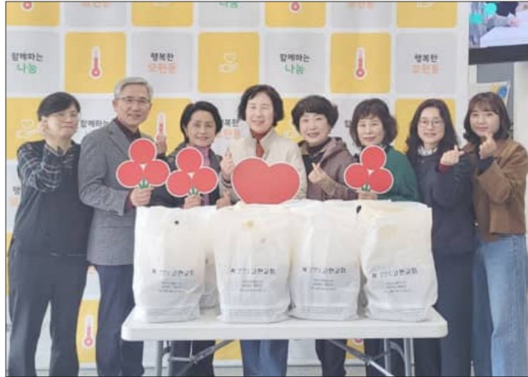
익산시 모현동이 '우리동네복지'를 중심으로 이웃을 위한 나눔이 이어지며, 지역사회에 따뜻한 변화를 만들어가고 있다