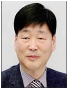
윤동욱 전주시장 권한대행