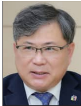
윤정기 전북교육감 권한대행

다시 한번 창간 15주년을 진심으로 축하드리며, 지역의 눈과 귀가 되어주는 전북타임즈의 무궁한 발전을 응원합니다. 감사합니다.