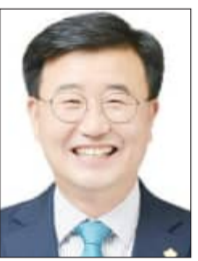
완주군의회 유희식 의장

주민자치1번지, 그리고 완주의 백년 먹거리 수도도시 1번지를 향해 힘차게 달려가는 완주군의회 유희식 의장입니다. 먼저, 전북타임스 창간 15주년을 진심으로 축하드립니다. 지난 15년 동안 전북타임스는 지역의 크고 작은 이야기를 성실하게 담아내며 도민과 늘 함께해 온 소중한 언론입니다. 빠르게 변화하는 미디어 환경 속에서도 흔들림