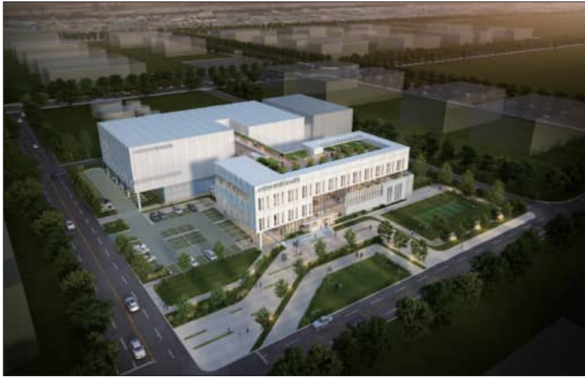
스마트수산가공종합단지 건립 조감도

군산시는 새만금개발청으로부터 사업단지의 입주, 공장등록 등 권한을 위임 받은 관리기관으로서, 지난해 11월 가공식을 개최한 스마트 수산가공센터를 비롯해 해수 인·배수시설 등 기반 시설과 공공지원시설, 민간기업의 개별적인 공사 진행 등 수산식품단지를 순조롭게 조성 중이다.