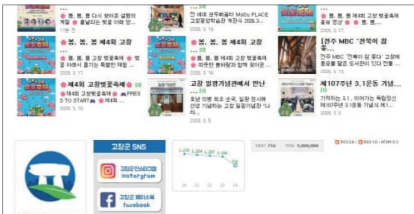
고창군 공식블로그 방문자 수 500만명 돌파

군은 공식블로그가 네티즌들로부터 호응을 얻으며 인기가 치솟고 있는 것은 '시기별 맞춤형 홍보'가 주요했기 때문으로 분석하고 있다.