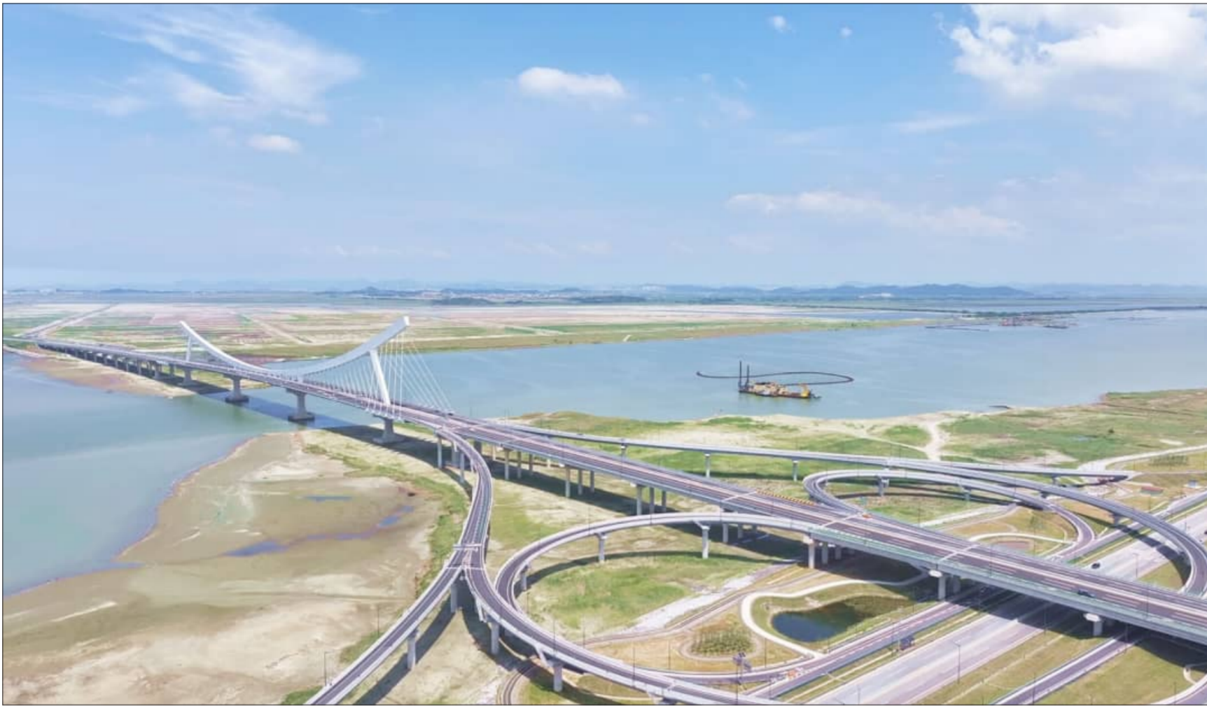
27일 창간 15주년을 맞은 본보는 앞으로 창간 50년, 100년을 향해 '약속의 땅' 새만금처럼 힘차게 비상을 다짐한다