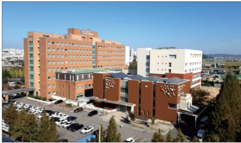
군산의료원 전경