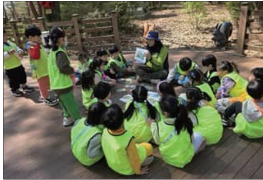
/부안=온봉기 기자 부안 서림공원 유아숲체험원 프로그램 운영

따라 계절별 자연체험 활동도 즐길 수 있다. 특히 전문 자격을 갖춘 유아숲지도사가 상주하며 부안의 특색에 맞는 연간 수시형·정기형 계절 맞춤 프로그램을 운영해 아이들의 발달 단계에 맞는 놀이 중심 교육을 제공한다. 이용 신청 및 자세한 문의는 부안군청 산림정원과 공원녹지팀으로 문의하면 된다. 군 관계자는 "아이들이 숲 체험을 통해 신체와 정서 모두 건강하게 성장할 길이라며 앞으로도 질 높은 산림교육과 안전한 시설관리에 최선을 다하겠다"고 말했다.