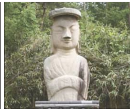
용화사미륵불입상 (전북특별자치도 유형문화유산)

-분류 - 유물, 석조, 불상 -지정일 - 1999년 7월 9일 -시대 - 고려시대 -소재지 - 부안군 행안면 역리 336-1번지