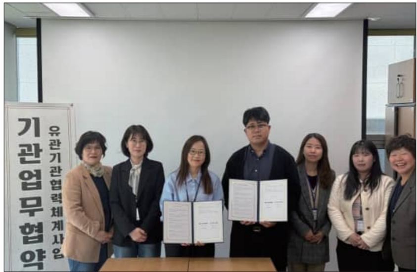
지난 2일 부안군정신건강복지센터와 부안군가족센터가 업무 협약을 체결했다.

부안군가족센터 관계자는 "가족의 안녕과 행복은 개인의 정신건강과 직결된다"며 "이번 협약을 통해 보다 전