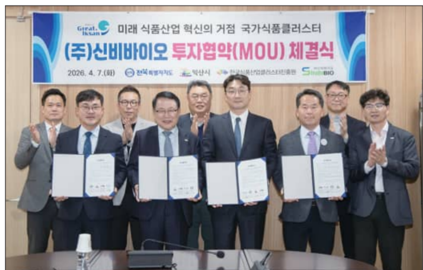
전북도는 7일 익산시, (주)신비바이오와 국가식품클러스터에 355억 원 규모 투자협약을 체결했다.

이번 협약은 2026년 들어 국가식품클러스터에서 체결된 다섯 번째 투자협약으로, 식품기업 입주 수요가 지속적으로 확대되고 있음을 보여준다.