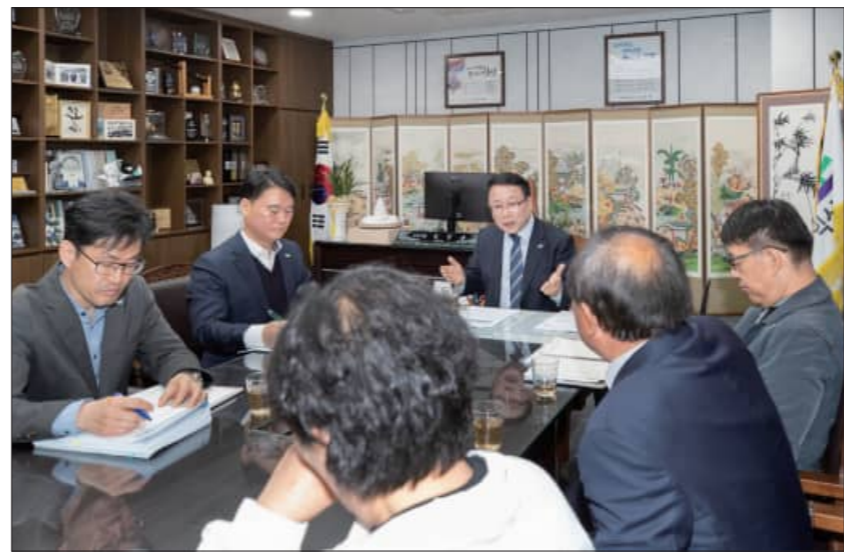
정현울 시장은 9일 익산로컬푸드협동조합원을 초청해 어양점 사태 해결을 위한 소통의 시간을 가졌다.

정성을 다해 농사를 지어 물건을 내놓는 농민의 노력이 헛되지 않게 하고, 매장을 믿고 찾는 시민들에게 피해가