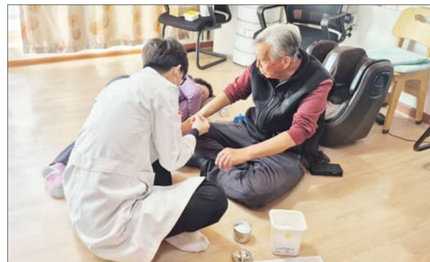
무주군이 오는 13일부터 거동이 불편한 장기 요양 재가 수급자를 대상으로 '재택 의료 서비스'를 시행한다고 밝혔다

서비스 대상은 장기 요양 재가 수급자 중 거동이 불편하거나 지속적인 의료 관리가 필요한 무주군민이며, 통합지원회의와 의료진의 진단을 거쳐 선정된다.