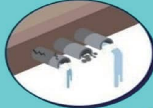
옹벽, 축대 주변

해빙기에는 주변에 공사장, 축대 등 위험시설을 주의깊게 살피는것이 대형 재난사고를 방지하는 가장 좋은 방법입니다.