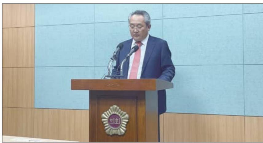
김성수 도지사 예비후보는 9일 도의회에서 기자회견을 열고 전북 정치 구조 개혁의 필요성을 역설했다. <전북타임스>

준이 되는 상황을 예로 들며 "이건 선택이 아니라 강요"라고 비판했다. 또한, 정책 부재에 대해 "새만금을 외치지만 실질적 산업용지조자 제대로 만들지 못하고 있다"며 "이는 정책이 아니라 실체 없는 공약 정치에 불과하다"고 꼬집었다. 김 예비후보는 책임 구조의 무너짐을 강조하며, 최근 논란이 된 '김관영 지사 대리비 사건'을 언급했다. 그는 "청년에게는 정치 생명을 걸고 책임을 묻지만, 권력의 책임은 보이지 않는다"며 "청년을 통제하려는 구조를 바꿔야 한다"고 강조했다. 이어 김 예비후보는 "이번 사태에 책임이 있는 정치권은 도민 앞에 사과하고 정치적 책임을 져야 한다"며 윤준병 전북도당위원장을 지적했다. 그는 "윤 위원장이 전북을 사랑한다면 말이 아니