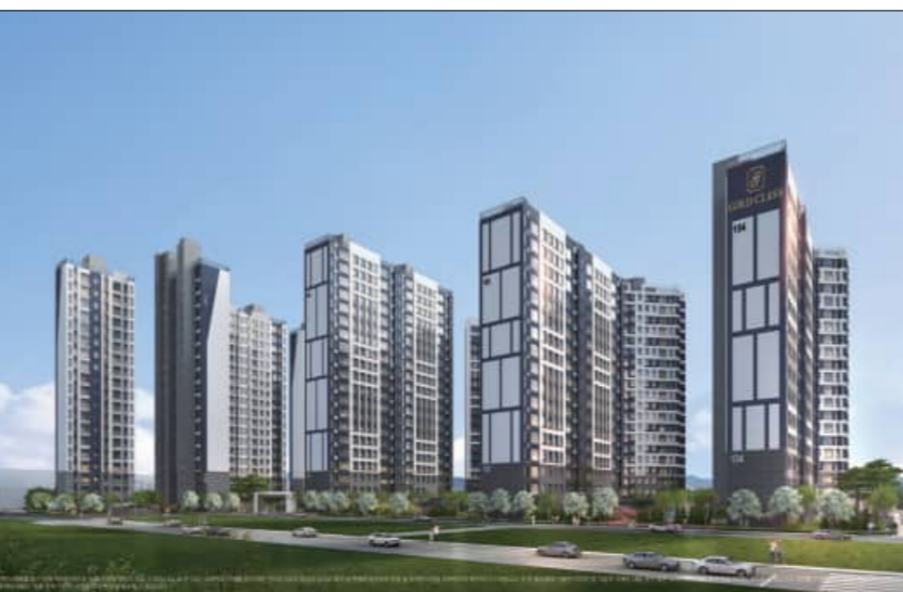
'골드클래스 시그니처' 투시도

단지내 실내 공프연습장, 스쿠린골프, 피트니스, GX룸을 비롯해 자녀들을 위한 실내놀이터, 맘카페, 돌봄센터, 도서관, 독서실 등이 마련돼 입주민들에게