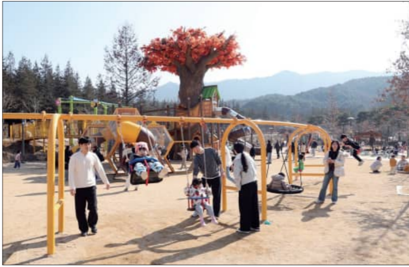
정읍 메이플랜드 내 '기적의 놀이터'

정읍시가 한국관광공사 주관 '빅데이터와 함께하는 똑똑한 맞춤 컨설팅 공모사업'에 최종 선정돼 메이플랜드(내장산 문화광장 일원)를 중심으로 한 체류 관광 전략 마련에 본격 나선다. 이번 공모 사업은 메이플 랜드를 중심으로 관광객의 이동과 머무는 흐름을 과학적으로 분석하고 스쳐 가는 관광에서 머무는 체류형 관광으로 이끔 구체적인 전략을 짜기 위해 추진된다. 내장산 문화광장은 최근 '기적의 놀이터'가 새롭게 조성된 이후 방문객이 급증하며 정읍의 새로운 관광 중심으로 급부상하고 있다. 특히 가족 단위 방문객이 크게 늘면서 단순한 나들이를 넘어 숙박과 소비로 이어지는 체류형 관광지로 발전할 가능성이 매우 높은 곳으로 평가받고 있다. 시는 이러한 긍정적인 흐름을 적극 반영해 이곳을 찾는 관광객의 유형과 이동 경로, 머무는 시간 등 방대한 대용량 정보(빅데이터)를 종합적으로 분석할 계획이다. 이를 통해 가족 단위 관광객의 이용 특성과 소비 형태에 딱 맞는 맞춤형