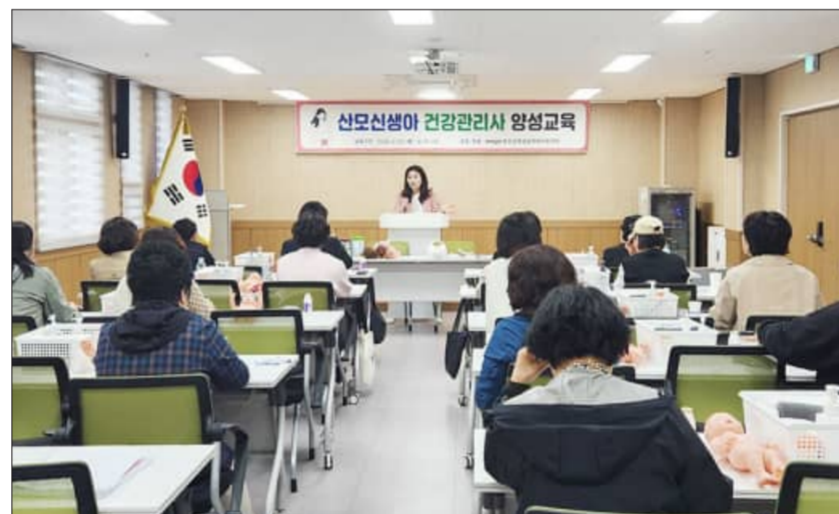
산모·신생아 건강 관리사 양성 교육