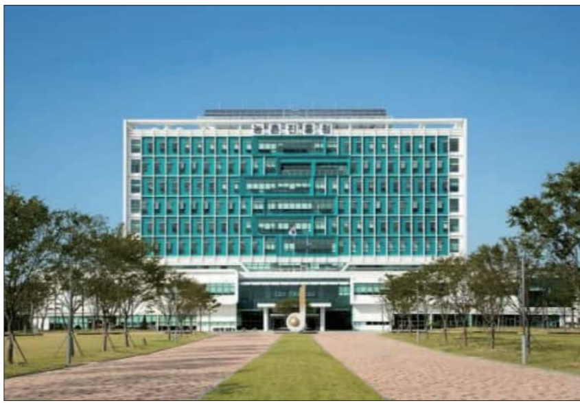
강조하는 소비 확대 정책을 추진하고 있다.

정부 역시 이러한 변화에 맞춰 단일 품종 쌀 유통을 장려하고 품종별 특성을