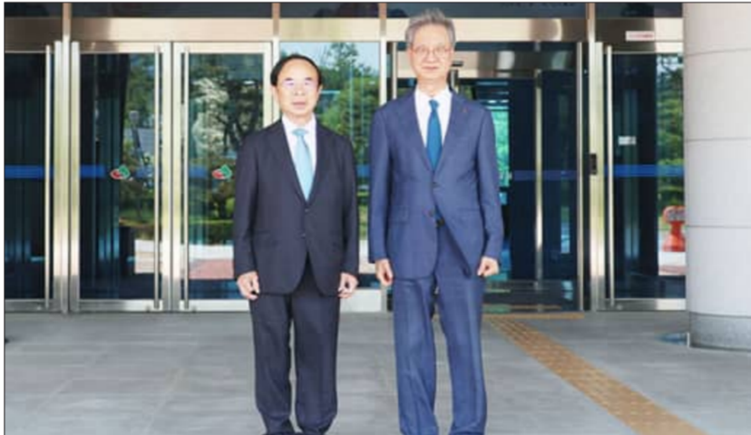
임실 출신인 손주석 한국석유공사 사장이 14일 고향인 임실군을 방문해 지역발전과 고향사랑기부제 활성화를 위한 협력 의지를 밝혔다

임실 출신인 손주석(孫周錫) 사장은 1960년생으로 전북 임실에서 태어나 전주고등학교와 경희대학교 정치외교학과를 졸업했으며, 에너지·환경 분야와 공공기관 경영 전반에서 풍부한 경