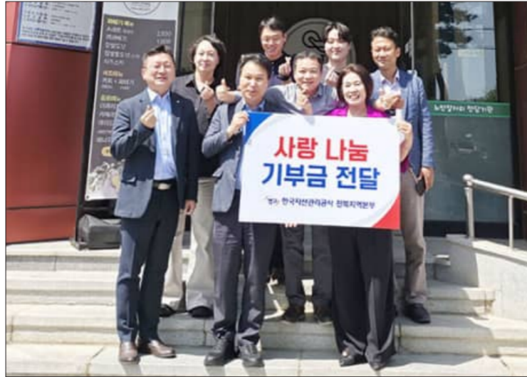
김제시니어클럽이 지난 13일 한국자산관리공사 전북지역본부와 함께 기부금 전달식 및 파배기 나눔 행사를 진행했다고 밝혔다