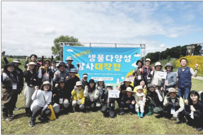
‘완주 만경강 신천습지 생물다양성 탐사대작전’이 지난 22일 완주군 삼례읍 신천습지 일원에서 개최됐다

22일 국제 생물다양성의 날 완주 만경강 신천습지서 생물다양성 탐사대작전 개최