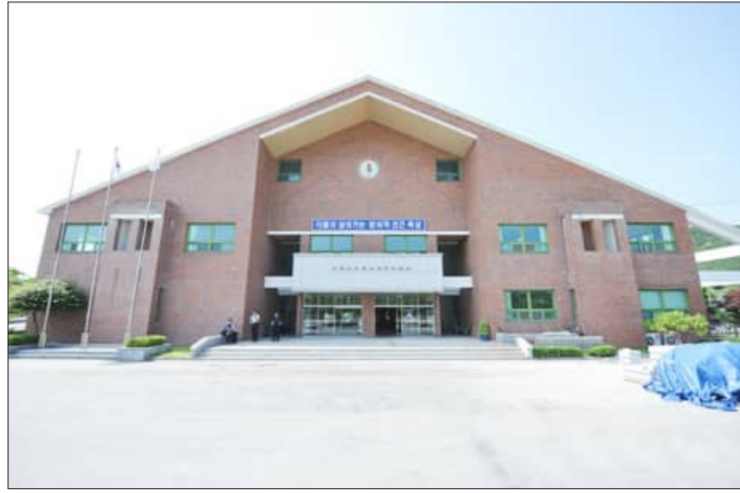
이날 현장에 참석해 각 기관의 경험 공유와 향후 체험교육의 방향 모색을 당부했다. /최성민 기자