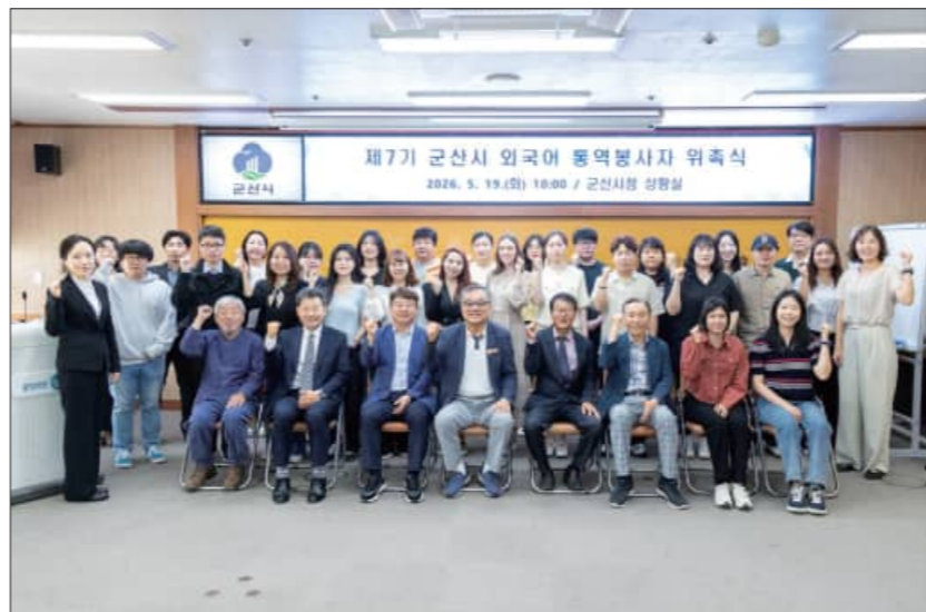
지난 19일 개최된 제7기 군산시 외국어 통역봉사자 위촉식

제행사와 해외 교류, 기업체 비즈니스 통역, 외국인 주민의 언어 지원 등 다양한 분야에서 활동하게 된다.