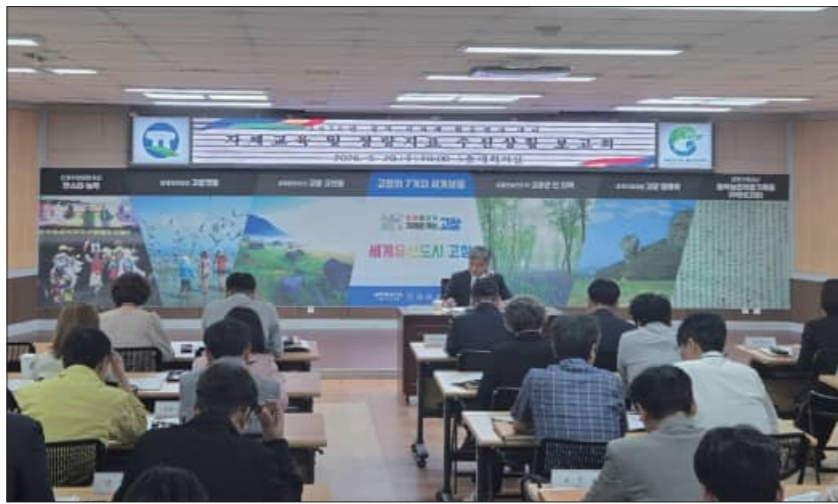
지난 20일 열린 고창군 '지자체 합동평가 추진상황 보고회'