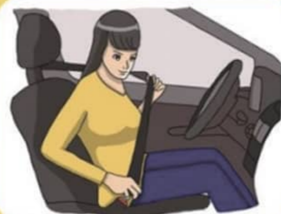
출발 전 안전띠 매는 습관 들이기