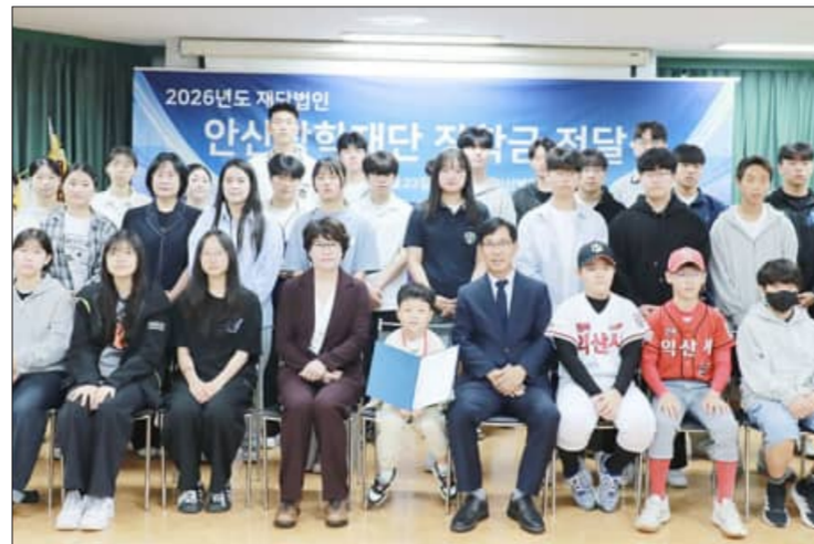
도전을 잃지 말고 자신의 가능성 격려했다.

이준 이사장은 "학생들은 미래 사회를 이끌어갈 소중한 자산"이라며 "어려운 상황 속에서도 꿈과