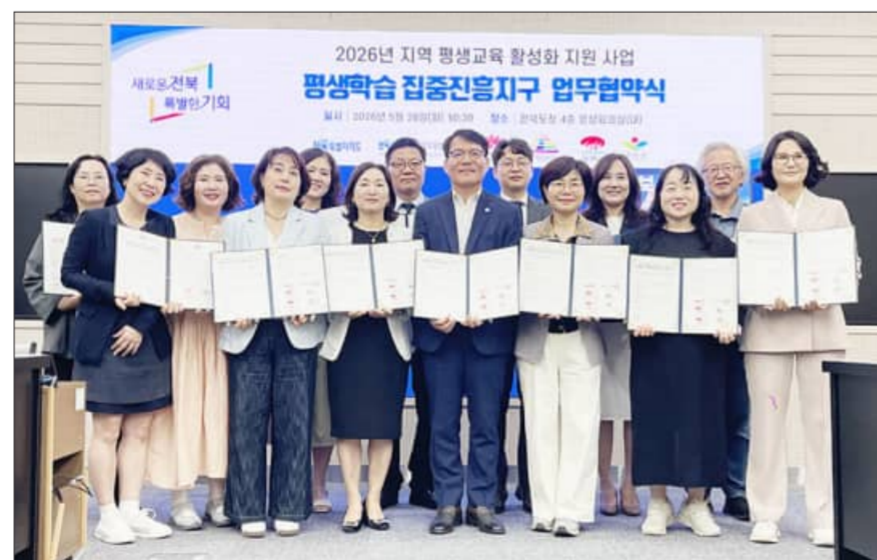
전주시는 26일 '2026년 지역 평생교육 활성화 지원사업-평생학습도시 특성화, 평생학습 집중진흥지구의 성공적 추진을 위한 업무협약'을 체결했다.

전주시가 전북도, 전북평생교육장학진흥원, 도내 평생학습도시, 지역대학 및 기업과 손잡고 전북형 평생학습 집중진흥지구 조성에 나서기로 했다. 시는 26일 전북특별자치도청 영상회의실에서 '2026년 지역 평생교육 활성화 지원사업-평생학습도시 특성화, 평생학습 집중진흥지구의 성공적 추진을 위한 업무협약'을 체결했다. 협약은 교육부 공모에 선정돼 추진되는 이 사업의 체계적인 운영을 위해 참여기관 간 정보를 공유하고, 유기적인 협업체계를 구축하기 위해 추진됐다. 이날 협약에는 전북특별자치도와 전북특별자치도평생교육장학진흥원, 전주시, 익산시, 김제시, 순창군이 참여했다. 협약기관들은 전북형 평생학습집중진흥지구 사업 추진을 위해 인적·물적 자원을 교류하고, 기관 간 사업관리 지원체