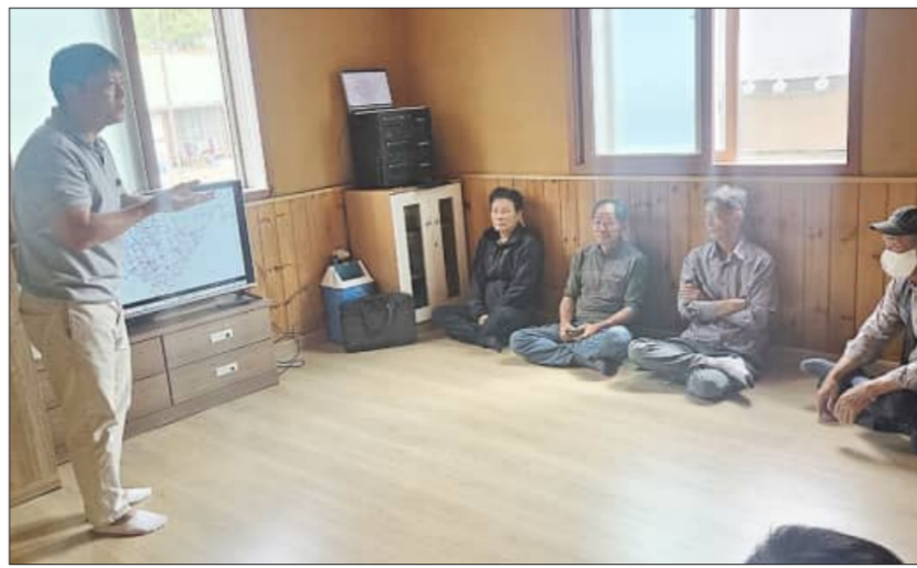
지역재조사 관련 마을 설명회

무주군에 따르면 26일 무풍면 원평지구 구로 시작으로 6월 10일부터는 북리지구 마을회관에 현장사무소를 설치·운영하며 무풍면 상하지구, 고도지구, 설천면 외양지 지구는 측량이 마무리되는 대로 현장사무소를 운영할 예정이다.