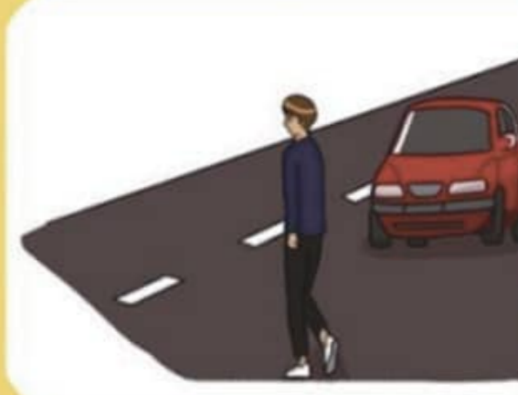
무단횡단 하지 않기