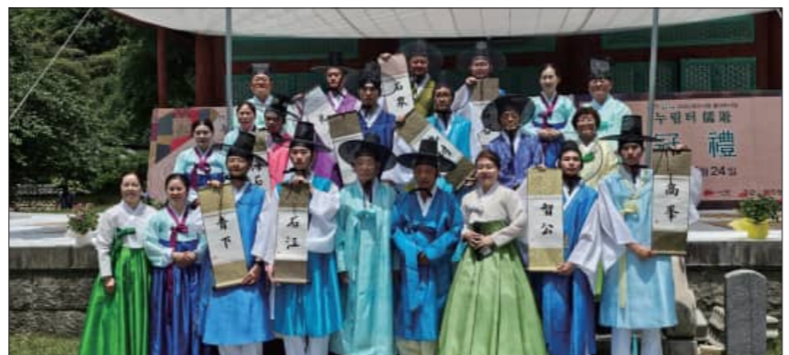
국립의 전통 예절과 정신문화를 이해하는 소중한 시간이 되었기를 바란다”고 밝혔다.