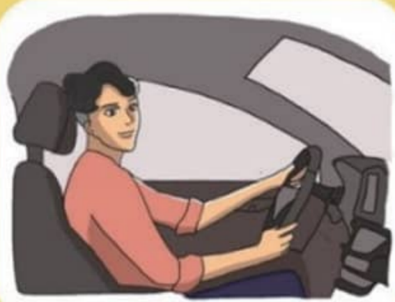
규정속도 준수로 과속하지 않기

사람의 소중한 생명을 앗아가는 교통사고, 교통안전수칙 준수로 예방이 가능합니다.