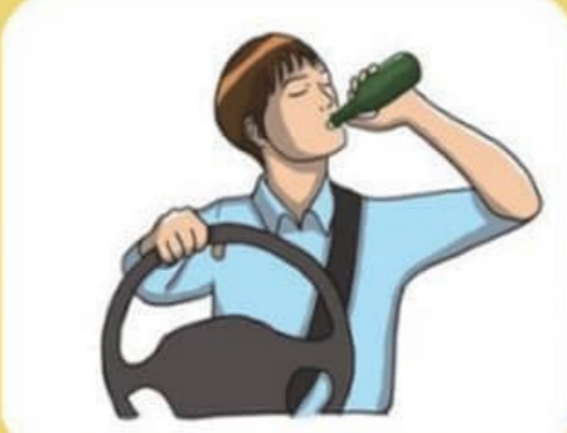
음주운전 절대 하지 않기