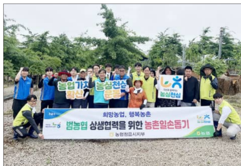
회양농업, 행복농촌을 위한 농촌일손돕기. NH농협 익산시지부, 농심전심