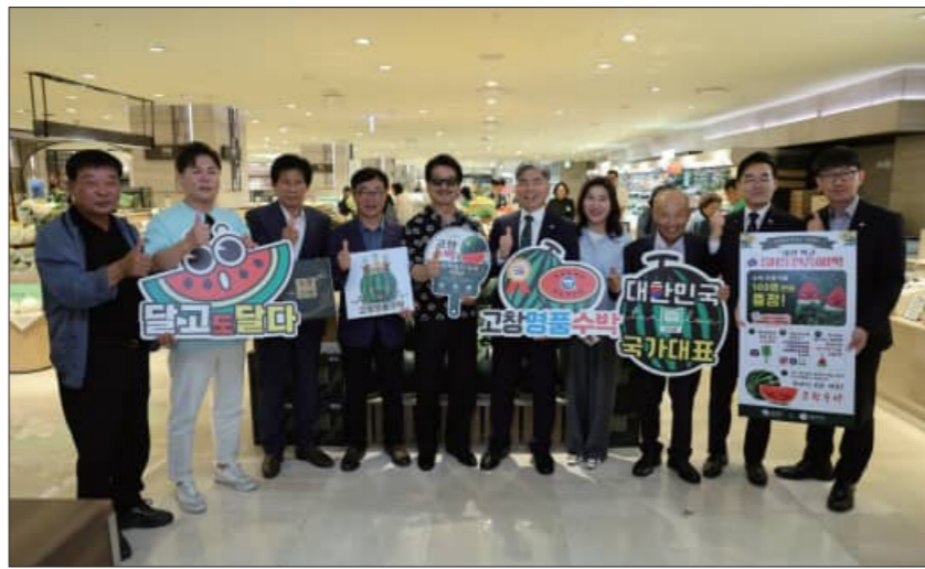
지난달 29일 서울롯데백화점 본점에서 열린 지리적표시 고창명품수박 홍보판촉전

이번 백화점 입점은 ‘지리적표시 고창수박’의 브랜드 가치를 높이고, 수도권 소비자들에게 고창수박의 우수성을 널리 알리기 위해 마련됐다. 특히 엄격