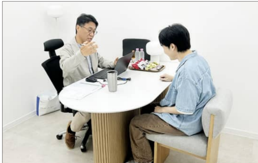
전주시 청년이음전주에서는 매일 마지막 주 금요일마다 '취·창업데이'가 운영된다.

전주시 청년이음전주에서는 매일 마지막 주 금요일마다 '취·창업데이'가 운영된다. '취·창업데이'는 취업과 창업 과정에서 다양한 고민을 겪는 청년들을 위해 마련된 맞춤형 상담 지원 날이다. 운영은 전문 상담사와 분야별 전문가가 참여해 하루 동안 정보 제공과 1:1 전문 상담을 제공한다. 취업 분야는 전주시 일자리센터와 원광대학교 일자리 첫걸음 보장센터가 협력 운영한다. 기초 취업 상담부터 진로 설정, 취업 준비 컨설팅 등 청년 개개인의 상황에 맞춘 상담을 제공한다. 또 청년이음전주 AI면접실 활용 상담