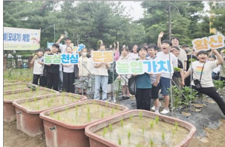
이를 통해 미래 세대의 정서 함양과 농업·농촌에 대한 이해를 높이고 농촌에 대한 애착을 높여준다는데 크게 기여하고 있다. /익산=최준호 기자

스쿨팜 프로그램은 전북특별자치도, 익산시, 교육청, 전북농협이 협력하여 도심 속 초등학교 내에 유휴 공간을 활용한 농업 체험장을 조성하고, 학생들이 직접 파종부터 수확까지 경험할 수 있도록 지원하는 지자체 협력 사업이다.