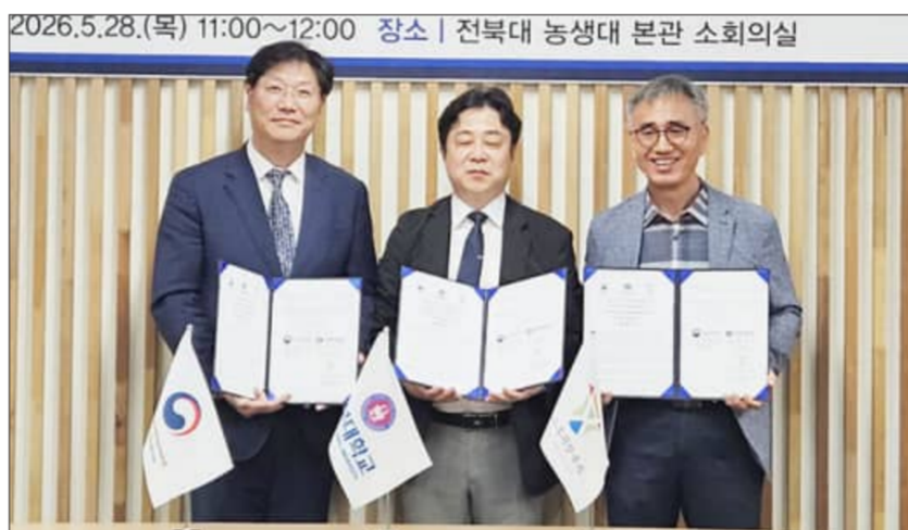
장수한우지방공사가 지난 28일 전북대학교 농업생명과학대학, 농촌진흥청과 축산분야 국제개발협력 지원 및 지역 상생 모델 구축을 위한 업무협약을 체결했다

오는 8월에는 네팔과 몽골, 우즈베키스탄, 키르기스스탄, 타지키스탄, 파키스탄 등 농촌진흥청 국제개발협력사업에 참여 중인 아시아 6개국 연구자를 대상으로 인공수정사 및 종축개량 전문가 양성 과정을 운영하고, 축산 현장 중심의 교육을 추진할 계획이다.