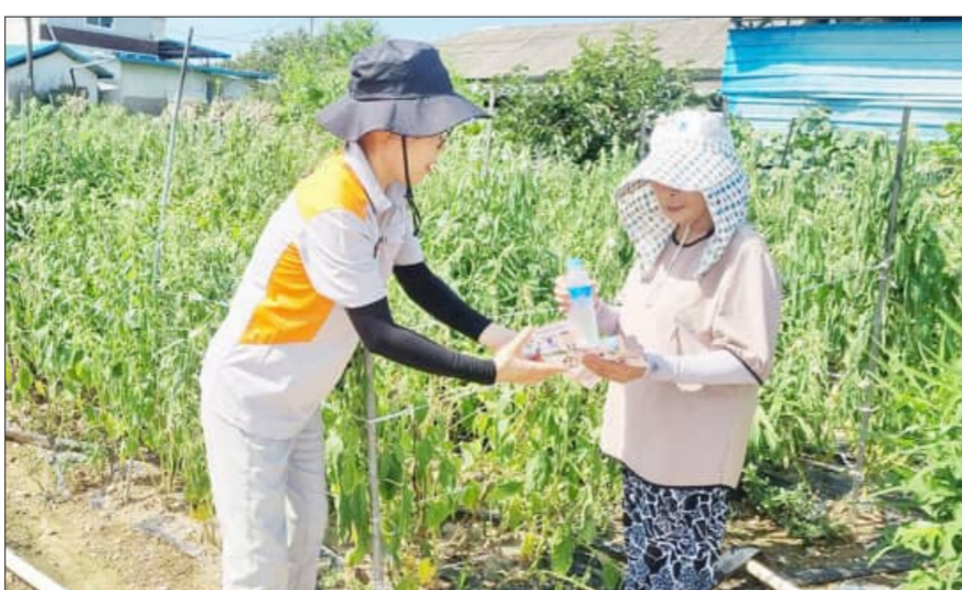
96건에서 2025년 347건으로 증가했다. 폭염이 장기화되고 한낮 농작업과 야외활동 위험이 커지면서, 재난 발생 이후 대응보다 마을 단위 예방과 조기 발견의 중요성이 높아지고 있다. 읍별 폭염 안전지킴이는 찾아가는 폭염예방 교육, 취약시간 예방순찰, 취약계층 돌봄활동, 무더위쉼터 이송지원으로 운영된다. 먼저 마을담당 의용소방대원이 2인 1

전북지역 온열질환 구급출동이 최근 5년 새 3.6배 증가한 가운데 전북소방본부가 여름철 폭염 취약계층 보호 위한 의용소방대 중심의 현장 예방활동을 본격 추진한다. 전북소방본부(본부장 이오숙)는 1일부터 오는 9월 30일까지 도내 15개 의용소방대연합회 362개대 8220명이 참여하는 '의용소방대 폭염 안전지킴이'를 운영한다고 지난달 29일 밝혔다. 폭염으로 인한 온열질환자 발생이 해마다 늘어나는 상황에서 지역 사정을 잘 아는 의용소방대원의 현장 네트워크를 활용해 농어촌 어르신, 야외작업자, 독거노인 등 폭염 취약계층을 선제적으로 보호하기 위해 마련됐다. 전북지역 온열질환 구급출동은 2021년