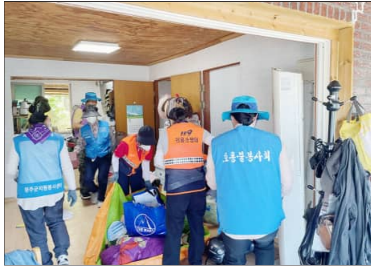
완주군 봉동읍 지역사회보장협의체 회원들이 장애와 질병 등 건강상의 이유로 집안 정리가 되지 않고 있는 취약계층의 가정을 찾아 주거환경 개선에 힘을 보탤다

호룡불봉사회의 지원으로 장판과 방충망 교체를 진행하고 싱크대를 설치했으며, 봉동여성의용소방대 대원들은 집 마당에 쌓여있는 쓰레기를 정리했다. 완주군 여성자원활동센터는 내부의 집을 정리하고 봉동읍 지역 사랑봉사단과 사랑드리봉사회는 대형폐기물과 가구를 옮기며 손을 다졌다. 봉동읍지역사회보장협의체 위원들은 이틀간 봉사단체들과 함께 주거환경개선의 전반을 함께하며 주거 취약계층을 위한 봉사에 구슬땀을 흘렸다.