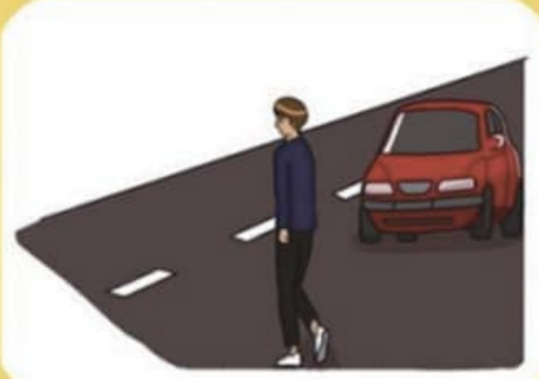
무단횡단 하지 않기