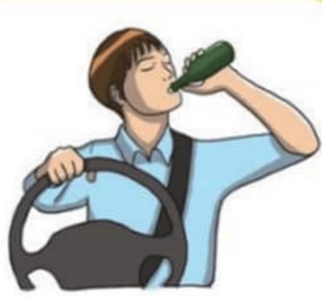
음주운전 절대 하지 않기