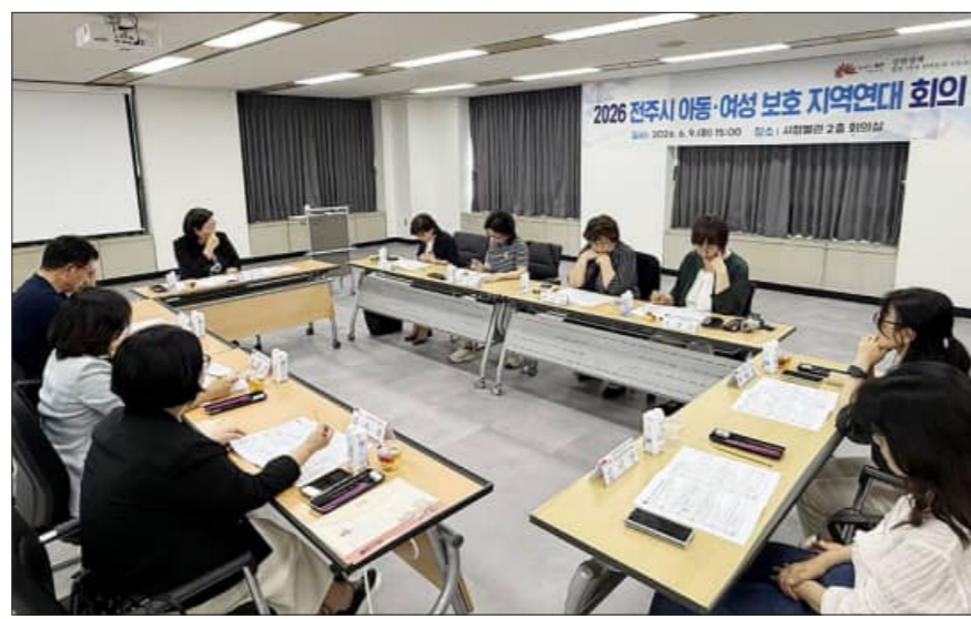
전주시는 9일 '2026년 전주시 아동·여성 보호 지역연대 회의'를 개최했다

전주시가 아동과 여성이 폭력과 범죄로부터 안심하고 살아가도록 유관기관 및 관련 전문가들과 머리를 맞댔다. 이에 시는 9일 경찰서, 교육청, 의료기관, 여성권익시설 관계자 등 아동·여성 보호 분야의 전문가들이 참석한 가운데 '2026년 전주시 아동·여성 보호 지역연대 회의'를 개최했다. 참석 위원들은 지난해 추진된 지역연대 사업의 주요 성과를 공유하며 올해 추진할 사업계획과 기관 간 협력 사항에 대해 깊이 있게 논의했다.