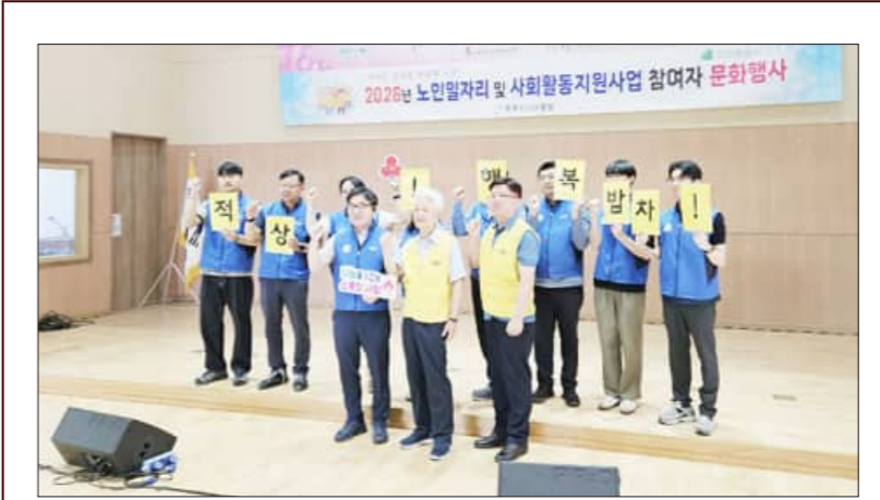
(사)무주군자원봉사사센터가 이동급식차량을 활용한 '온정을 나르는 행복밥차' 운영에 본격 나섰다