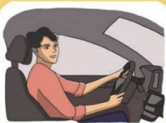
규정속도 준수로 과속하지 않기

사람의 소중한 생명을 앗아가는 교통사고, 교통안전수칙 준수로 예방이 가능합니다.