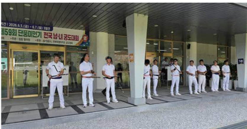
올랐다. 단체전은 1차 기록 경기로 16강을 추린 뒤 승자 진출전(토너먼트) 방식으로 최종 승자를 정했다. 경기력도 우수해 15발을 쏘 모두 명중시키는 '15시 15중' 달성자가 장년부 5명, 여자부 2명, 실업부 1명 등 총 8명이 나왔다. /정읍=김정민 기자

정읍 필야장에서 지난 5일부터 7일까지 전국 궁사 1282명이 참가해 전통 무예인 활쏘기 기량을 겨루는 제59회 정읍단풍미인컵 전국남녀궁도대회가 치러졌다. 이번 대회는 정읍시체육회와 정읍시 궁도협회가 주최하고 정읍 필야장이 주관했다. 3일간 이어진 행사에 단체전 93팀(465명)과 개인전 817명 등 총 1282명이 출전해 평소 갈고닦은 실력을 뽐냈다. 경기 결과 단체전 우승은 대전 대동정이 차지했다. 개인전에서는 고창 모양정 이종민(장년부), 남원 관덕정 이종규(노년부), 순창 육일정 김은미(여자부), 군산 진남정 박정수(실업부) 선수가 각각 부문별 1위에