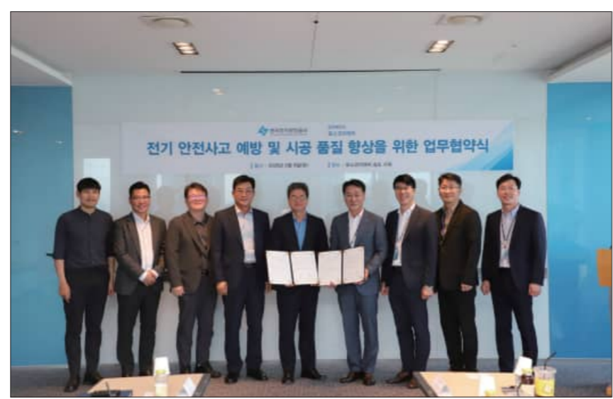
선도하는 포스코이앤씨와의 협력을 통해 국민이 안심할 수 있는 안전한 주거 환경 조성에 기여하겠다"며 "이번 협약이 건설현장 전기안전 관리 수준을 한