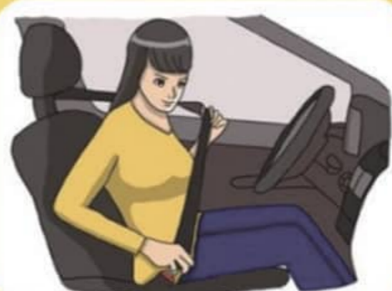
출발 전 안전띠 매는 습관 들이기