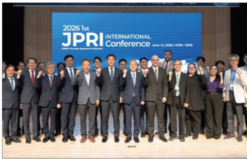
특히 퍼듀대 교수진은 전북대가 핵심 과제로 추진 중인 '서울대 10개 만들기' 사업과 관련해 글로벌 선도대학 운영

전북대학교는 지난 12일 교내 인터내셔널센터에서 미국 퍼듀대학교와 공동 설립한 공동연구거점(JPRI)의 국제 컨퍼런스를 개최했다. 양 대학 연구진은 이번 행사에서 피지컬 AI(Physical AI)와 미래 모빌리티, 첨단 국방 등 미래 전략산업 분야의 연구비전을 공유했다. 컨퍼런스에는 양오봉 전북대 총장과 디미트리오스 페틀리스 퍼듀대 수석부총장 등 양측 핵심 관계자들이 참석해 세부 협력 방안을 논의했다.