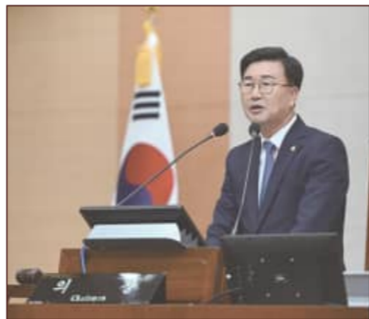
유익의 의장

복이 공직자 여러분의 손끝에 달려 있다"며, "그 막중한 책임을 영광과 자부심으로 삼아 흔들림 없는 군정을 이끌어달라"고 요청했다. 아울러 보이지 않는 곳에서 의회를 지탱해 준 의회사무국 직원들의 노고에도 감사를 잊지 않았다.