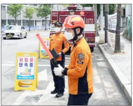
일부터 오는 19일까지 이어지며 사람과 차가 많이 다니는 변화한 거리에서 펼쳐

전주완산소방서가 위험물 운송 과정에 따르는 사고 예방을 위해 위험물 운송·운반차량 검사를 이어간다고 지난 12일 밝혔다. 이유로는 위험물 운송·운반 과정 중 발생할 수 있는 화재와 폭발 등에 따른 것으로 각종 사고를 사전에 예방하기 위해서다. 위험물 운송·운반차량 검사는 지난 8