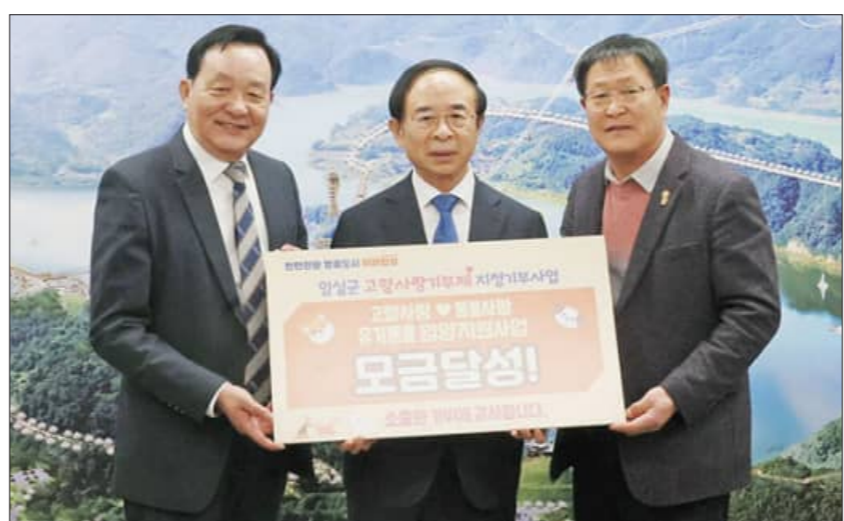
임실군이 올해 처음 추진한 고향사랑기부제 지정기부사업들이 축제를 연계한 전국적인 홍보에 힘입어 목표한 모금액을 일찌감치 달성하는 데 성공했다.

군은 유기동물 입양 가정의 초기 경제적 부담을 덜고 책임 있는 반려문화 정착을 위해, 올해 초 1천만원을 목표로 모금을 시작했으며, 약 한달만에 목표