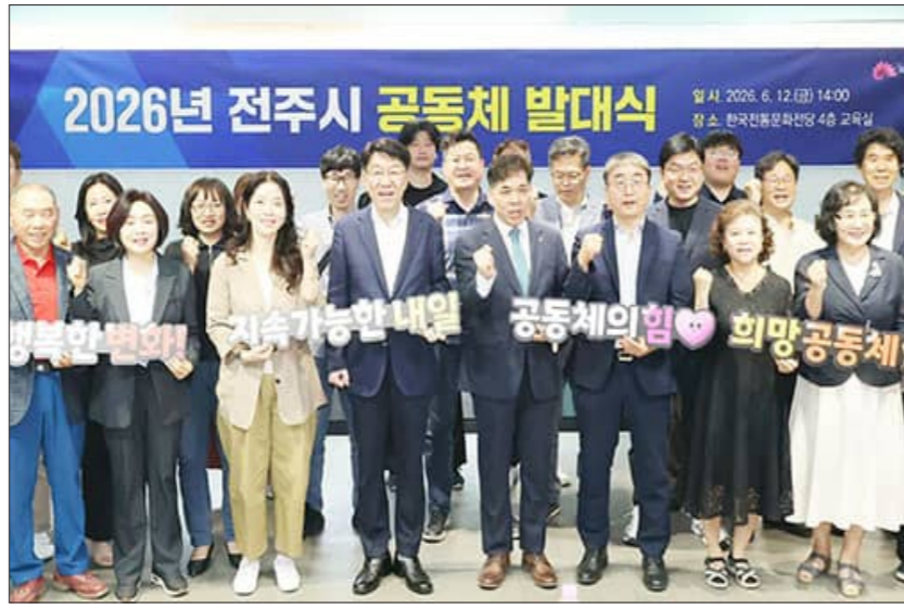
우범기 전주시장은 지난 12일 41개 공동체 대표 및 관계자 등과 함께 ‘2026년 전주시 공동체 발대식’을 개최했다

전주시가 따뜻한 지역사회 위한 시민 공동체 지원사업 등의 성공적인 추진에 지원한다. 우범기 전주시장은 지난 12일 41개 공동체 대표 및 관계자 등과 함께 ‘2026년 전주시 공동체 발대식’을 개최했다. 이날 발대식에서는 전주시 공동체 지원사업의 성공적인 사업 추진을 다짐하는 퍼포먼스가 펼쳐졌다. 또 공동체 관계자들을 대상으로 사업비 교부·신청·집행·정산 등 공동체별 사업 추진에 필요한 회계 및 전산 실무 교육이 진행됐다. 이와 관련 ‘전주시 공동체 지원사업’은 지역주민들이 공동체 가치를 바탕으로 지역사회 발전을 위한 다양한 사업을 추진하고, 소통과 화합을 통해 공