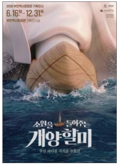
전시를 통해 관람객들이 부안의 역사와 문화를 쉽고 흥미롭게 이해하고, 지역 설화가 지닌 문화적 가치와 의미를 새롭게 발견하는 계기가 되기를 바란다"고 말했다. /부안=온봉기 기자

부안군문화재단은 16일부터 12월 31일까지 부안역사문화관 기획전시실에서 '소원을 들어주는 개양할미'를 전시한다고 밝혔다. 이번 전시는 부안을 대표하는 설화인 '개양할미'를 쉽고 친근하게 이해할 수 있도록 기획된 전시로, 부안 바다를 지켜온 거대한 수호신으로 전해지는 개양할미 이야기를 다양한 전시 콘텐츠로 재구성해 선보인다. 전시는 '거인', '수호신', '소원'이라는 세 가지 키워드를 중심으로 구성된다. 바닷물이 발목밖에 닿지 않을 만큼 거대한 몸집을 가진 개양할미가 서해 바다를 걸어 다니며 뱃길을 살피는 이야기부터 계란여 설화와 여덟 딸 이야기, 수성당에 전해지는 신앙 이야기 등 부안 곳곳에 전해 내려오는 개양할미 설화를 한자리에서 만나볼 수 있다. 부안군문화재단 관계자는 "이번