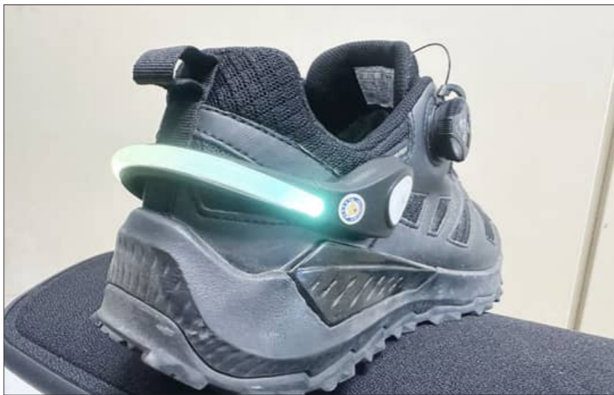
관 등을 방문하며 홍보했다. 민들에게 ‘발빛 교통안전 프로젝트’를 인지시키고 설명했다. 이와 함께 경찰은

전북경찰청이 전국 최초 신발 부착형인 LED 안전등 활용에 도내 고령 보행자 또는 자전거 이용자의 야간 교통사고 예방을 추진한다. 전북경찰청 이재영 청장은 지난 10일 ‘발빛 교통안전 프로젝트’를 운영한다고 밝혔다. 전북경찰청 ‘발빛 교통안전 프로젝트’는 LED 안전등으로서 신발에 간편하게 부착할 수 있다. 야간 보행자나 자전거 이용자의 움직임을 쉽게 알 수 있도록 하는 안전장치 일일이기도 하다. 관련해 경찰은 앞서 “발빛 ON, 사고 OFF” 슬로건을 활용한 새벽길 보행자가 많은 △중교시설 △경로당 △노인복지