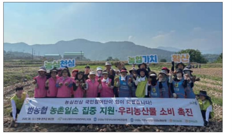
전북농협이 지난 12일 관내 취약계층을 찾아다니며 양파장아찌 나눔활동을 펼쳤다.

패키지 프로그램을 지원받게 된다. 이와 함께 최종 선정 시 기업당 연간 최대 5000만원 상당 맞춤형 밀착 지원이 제공된다. 신청 접수는 방문이나 우편 접수 없이 '기업지원사업 관리시스템(RMS)'을 통해 온라인으로만 진행된다. 세부적인 지원 요건과 공고 내용은 전북테크노파크 공식 홈페이지 또는 RMS 사이트 그리고 각 시·군별 사업 담당자에게 문의하면 된다. /김영태 기자