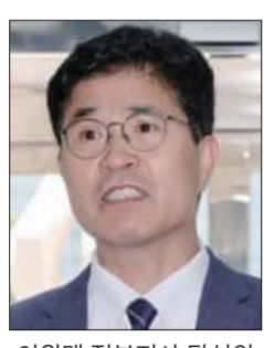
이원택 전북지사 당선인

식사비 대납·허위사실 공표 등 선거 끝나며 경찰 수사 속도전 공소시효 감안해 9월 말 결론 결과 따라 민선9기 초반 변수