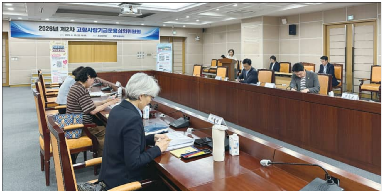
고향사랑기부금 도민 체감사업으로 전북도는 지난 15일 도청 종합상황실에서 2026년 제2차 고향사랑기부금운용심의위원회를 열고 복지·안전·문화 분야 기부사업 8건을 최종 의결했다.

이 당선인은 12·3 비상계엄 당시 도지사였던 김 후보가 도청 폐쇄, 준예산 편성 등을 시행해 계엄에 동조했다는 의혹을 수차례 제기했으나 2차 종합특검은 김 후보에 대해 불기소 처분을 내렸다. 아울러 선거당시 이 당선인측이 무소속 김관영 후보의 대리운전비 현금 살포를 당내 경선에 이용하기 위해 관련자들