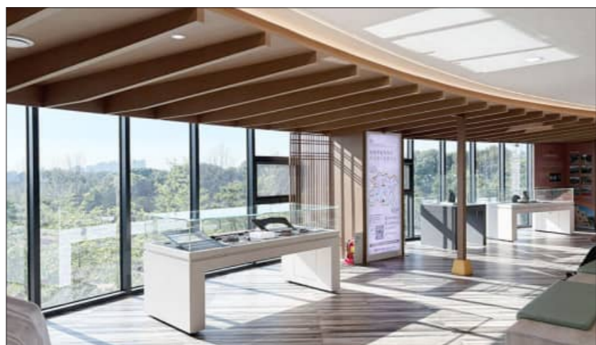
장수군은 김제휴게소 2층 전망대에서 7월 9일까지 '2026 박물관 IN 휴게소-백두대간을 품은 장수 가야' 특별전을 개최한다고 16일 밝혔다.

전시 주제인 장수가야는 고대 백두대간 호남정맥을 중심으로 독자적인 문화를 꽃피운 세력으로, 뛰어난 철기 생산 기술을 바탕으로 봉화유적과 다수 고분군을 남긴 전북 동부권 대표 역사문화유산이다.