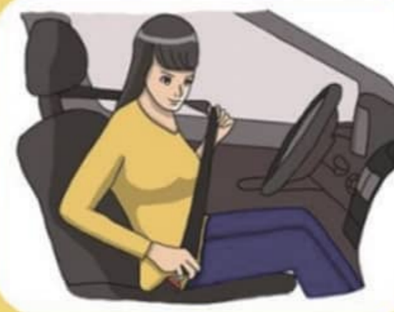
출발 전 안전띠 매는 습관 들이기