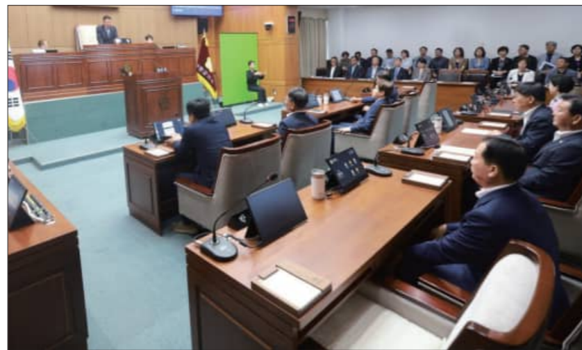
부안군의회는 16일 제371회 임시회를 개최하고 제9대 마지막 회기 운영에 들어갔다.