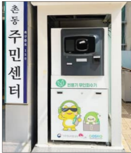
낮 위주로 운영한 후, 향후 시민들의 이