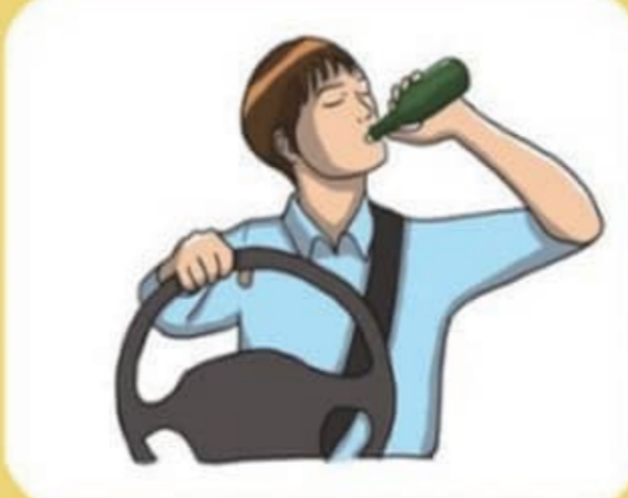
음주운전 절대 하지 않기