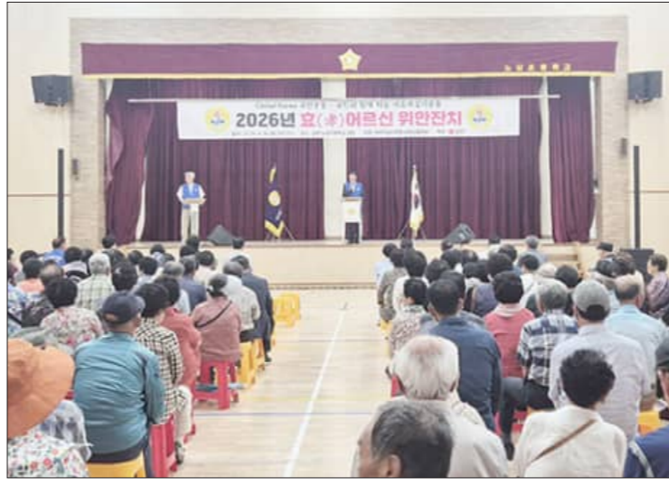
난 이웃들과 안부를 나누고 답소를 이어가는 등 행사장 곳곳에서 따뜻한 정이 넘쳐났다.

이어 참석자들은 정성껏 마련된 음식을 함께 나누며 화합과 소통의 시간을 가졌으며, 오랜만에 만