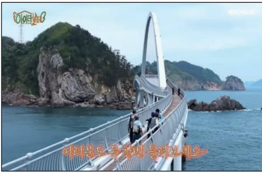
배경으로 한 이국적인 풍경을 만끽했으며, 명도에서는 구렁이전망대와 오진여전망대에 올라 고군산군도의 장엄한 해상 경관을 감상했다.

이후 K-관광섬 고군산섬잇길을 따라 말도에서 보농도를 지나 명도까지 트레킹을 이어갔다. 섬과 섬을 잇는 제1교·제2교를 건너며 탁 트인 서해 바다를