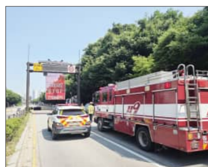
로 빈틈없는 수난사고 대응체계를 구축

이에 전주덕진소방서는 위험지역 관리와 구조장비 점검, 실전형 훈련을 중심으