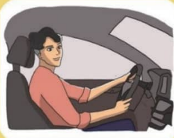
규정속도 준수로 과속하지 않기

사람의 소중한 생명을 앗아가는 교통사고, 교통안전수칙 준수로 예방이 가능합니다.