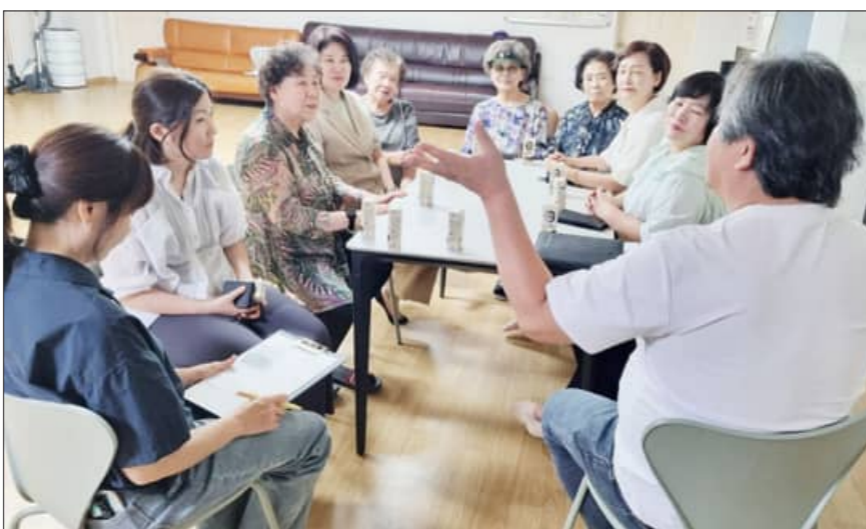
전주시는 23일 본격적인 폭염에 대비해 경로당과 독거노인가정을 직접 찾아 위문 방문을 실시했다

특히 시는 향후 폭염특보가 발효되면 거동불편자 등 폭염 고위험군을 중심으로 생활지원사의 전화·방문 안전 확인을