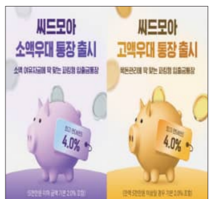
모두 동일하게 △마케팅 동의 연 0.2% △전북은행 첫 거래 고객 연 0.8% △보너스금리 연 1.0%가 적용되며 우대금리는 가입 후 3개월간 제공된다. 전북은행 관계자는 “유동성과 수익성을 동시에 고려하는 고객이 늘어나는 만큼 자금 규모에 따라 혜택을 선택할 수 있도록 씨드모아 신상품 2종을 출시하게 됐다”고 말했다. 이어 “앞으로도 고객 중심의 상품 혁신을 통해 합리적인 자산 운용을 지원해 나가겠다”고 밝혔다. 신상품 2종은 ‘속뱅크’ 및 ‘전북은행 모바일웹’에서 가입할 수 있다. 자세한 내용은 전북은행 속뱅크 또는 고객센터를 통해 문의하면 된다. 김영태 기자

전북은행이 예치금 고객들의 유리한 금리 적용 혜택이 따르는 맞춤형 파킹통장 ‘씨드모아 소액우대 통장’과 ‘씨드모아 고액우대 통장’을 출시했다. 이번 출시 신상품 2종은 개인고객 누구나 가입 가능하며 고객의 자금 규모에 따라 선택해 가입할 수 있다. 두 상품은 입출금 통장임에도 가입 후 3개월간 우대금리 포함 최고 연 4.0% 금리를 제공하고 기간 종료 후에도 연 1.8%~2.0%의 기본 금리를 제공해 단기 여유자금을 효율적으로 관리하려는 고객은 물론 목돈을 예치하는 고객까지 금리혜택을 받을 수 있다. 특히 씨드모아 소액우대 통장은 소액 자산을 집중 운용하는 고객이 높은 금리 혜택을 누릴 수 있는 상품으로 5천만원 이하 금액에 기본금리 연 2.0%, 5천만원 초과 금액에는 연 1.8%를 제공한다. 또 씨드모아 고액우대 통장은 고액 자산을 유지하는 고객에게 높은 금리를 제공하는 상품으로 잔액이 5천만원 이상일 경우 기본금리 연 2.0%, 5천만원 미만일 경우 연 1.8%를 제공한다. 관련해 우대금리 조건은 신상품 2종