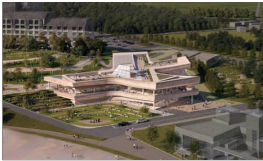
전북 서해안 유네스코 세계 지질공원 디스커버리 센터 조감도