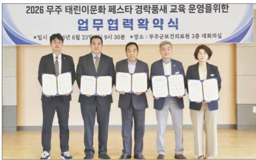
2026 무주 태린이문화 페스타 경락품새 교육 업무협력 협약식

경락품새는 태권도 품새 동작에 스킨라크와 △자세 관리, △균형 운동 요소를 접목한 어른신 맞춤형 태권도 프로그램으로, 무리한 동작보다는 어른신들이 안전하게 따라 할 수 있는 저강도 동작 중심으로 구성하는 등 신체 균형 유지와 건강한 여가 활동을 돕는 데 초점을