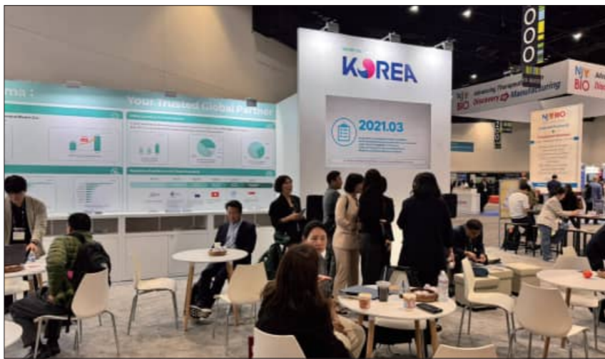
무대에서 알리는 데 주력했다. 공동부스 운영 기간에는 전북기업 카탈로그 배포, 기업별 관심 분야 매칭, 투자·협력 상담 수요 기록, 후속 미팅 연계 등이 진행됐다. 전북테크노파크는 현장에서 확보한 상담 내용과 명함, 관심 기업 정보를 바탕으로 귀국 후 기업별 후속 연락과 미팅 연계를 추진할 계획이다. 김영태 기자

해외 방문객의 관심 분야를 바탕으로 기업별 기술·제품·협력 희망 분야를 설명하고, 투자, 공동연구, 기술이전, 임상협력, 유통, OEM·ODM 등 후속 연계 가능성을 발굴했다. 공동부스에는 전북 바이오기업인 ‘플라스마바이오, 아이메디텍, 메디사피엔스, 노보렉스, 바이엘티, 유스바이오글로브’ 6개사가 참여했다. 이들 기업은 AI 기반 신약개발 및 비임상 연구 자동화, 정밀진단, RNA 치료제, 재생의료·의료기기, 세포치료제 등 다양한 바이오헬스 분야에서 보유 기술과 제품 경쟁력을 소개했다. 전북TP는 특히 전북이 바이오 R&D, 비임상·임상, 제조, 치료까지 이어지는 전주 바이오산업 생태계를 보유한 지역이라는 점을 중점적으로 홍보했다. 이를 통해 전북 바이오기업의 기술력과 해외 협력 가능성을 글로벌 시장 관계자에게 전달하고, 지역 바이오산업의 성장 기반을 국제