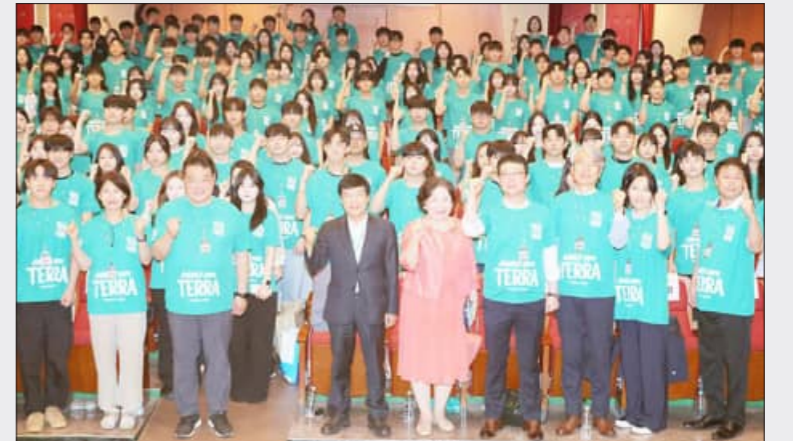
전주가맥축제 '가맥지기' 발대식이 23일 펼쳐졌다